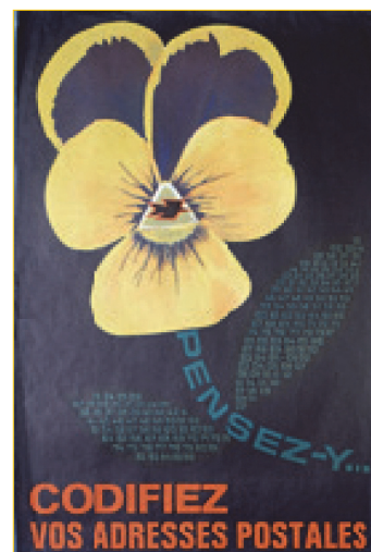
Affiche publicitaire, 1965. Musée de la Poste, Paris

Inspiré des expériences des Etats-Unis, de l'Allemagne et de la Grande-Bretagne, qui ont déjà élaboré leur propre codification, le codage français est testé à partir de 1964 et finalement adopté le 26 octobre 1965. Un pas décisif qui a été officialisé par une vaste campagne publicitaire ! (affiche ci-contre, Musée de La Poste, Paris)